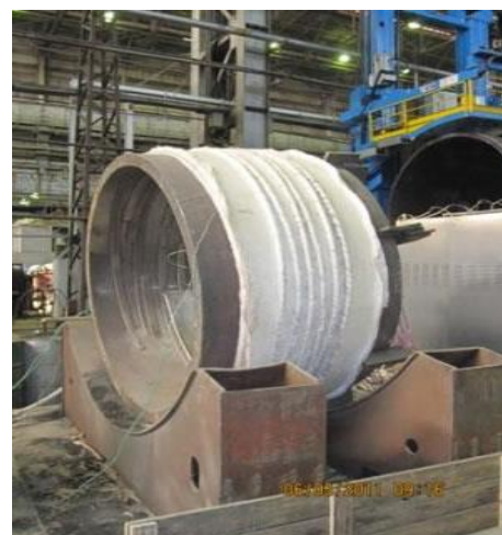
Рис.6 изоляционное покрывало